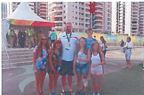
Wjazd na Letnie Igrzyska w Rio de Janeiro