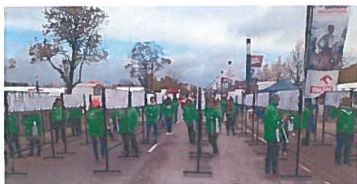
Wolontariat na ORLEN Warsaw Marathon