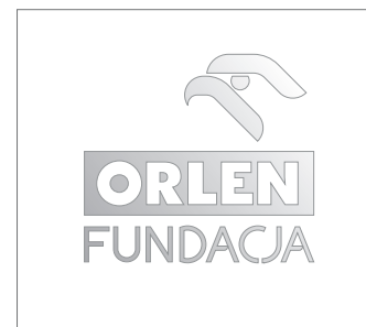
srebrny/stalowy Znak na białym tle