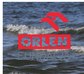
zdjęcia lub ich fragmenty zaburzające czytelność