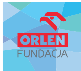
tła o mocnej ornamentyce zaburzającej czytelność