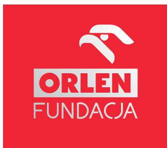
srebrny/stalowy Znak na czerwonym tle