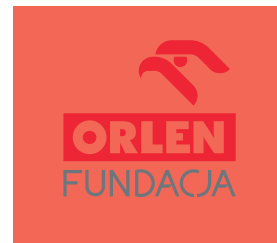
tła o małym kontraście względem znaku