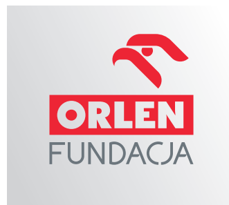
podstawowy Znak na srebrnym/stalowym tle